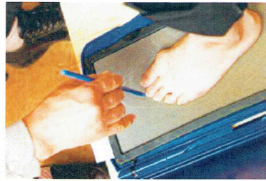
フットプリントから多くのことがわかります