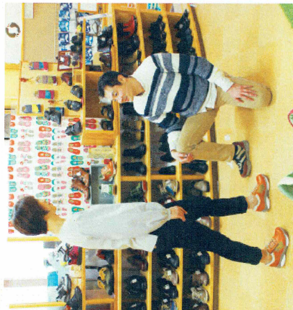
A級ライセンスの歩行トレーナーが優しい笑顔で靴しくチェック