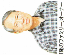
靴のフェアミラー「オーナー