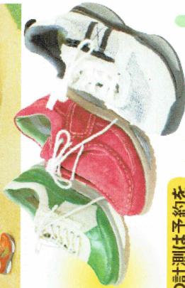
ストレッチウオーカーは、踵(かかと)から着地して親指で蹴り出す「あおり運動」を促します